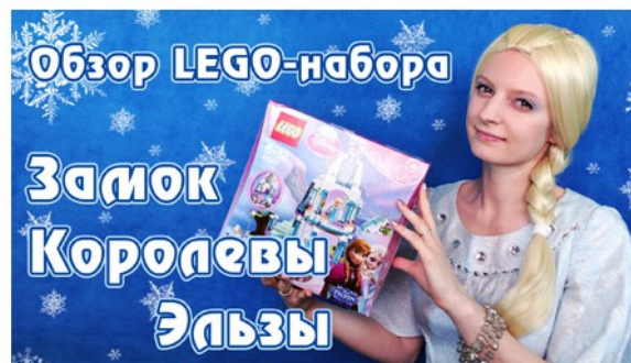
Сборка и обзор набора LEGO - Замок Королевы Эльзы