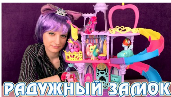
Обзор игрового набора My Little Pony - Радужный замок Принцессы Твайлайт Спаркл