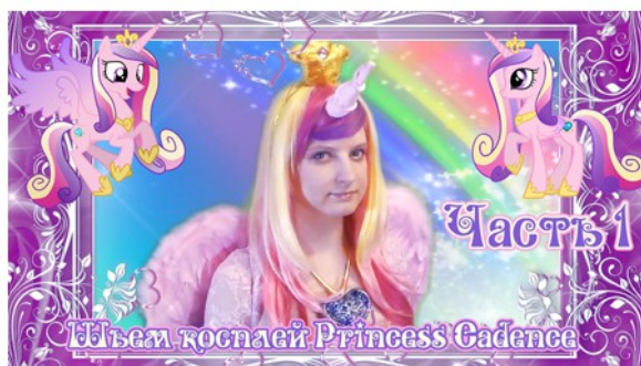
Шьем костюм Princess Cadence

Название моего канала включает в себя слово «креативный», и это полностью оправдывает его содержимое. Кроме творческого подхода к съемкам даже простых «распаковок», я делаю видео на несколько именно креативных тем — готовка различных вкусностей, рукоделие, покадровая анимация (с использованием игрушек) и прочее. Это делает канал более разнообразным и интересным для подписчиков.