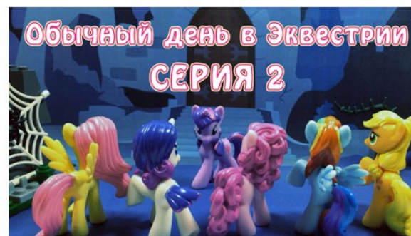
My Little Pony - Обычный день в Эквестрии - серия 2