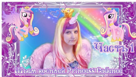
Шьем костюм Princess Cadence

Название моего канала включает в себя слово «креативный», и это полностью оправдывает его содержимое. Кроме творческого подхода к съемкам даже простых «распаковок», я делаю видео на несколько именно креативных тем — готовка различных вкусностей, рукоделие, покадровая анимация (с использованием игрушек) и прочее. Это делает канал более разнообразным и интересным для подписчиков.