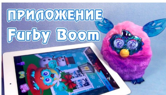
Обзор русского Ферби Бум Кристал (Furby Boom Crystal)

Одним из основных форматов роликов на моем канале являются обзоры игрушек. По мотивам сериала My Little Pony ежегодно выходит огромное число различных пони, кукол и прочих тематических вещей. Чтобы как-то сориентировать людей в этом многообразии и помочь выбрать подходящий для них продукт, я стараюсь снимать детальные обзоры на те или иные линейки игрушек. Зачастую официальные рекламные ролики не дают какого-либо понимания о вещи: из чего она сделана, как ощущается в руках и прочее. Поэтому тема обзоров на YouTube так популярна — люди хотят знать мнение других людей о том, что они собираются приобретать.