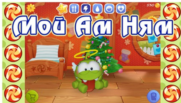
Обзор игры Мой Ам Ням (My Om Nom)

Еще одной достаточно популярной темой на моем канале являются мобильные и компьютерные игры. Качественная запись игр с мобильных устройств привлекает много интересующихся. Основная их масса также посвящена My Little Pony, однако ролики с другими персонажами, например Ам Нямом (мобильная игра My Om Nom), также собирают большое число просмотров и комментариев.