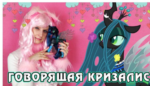
Обзор игрушки My Little Pony - говорящая Королева Кризалис