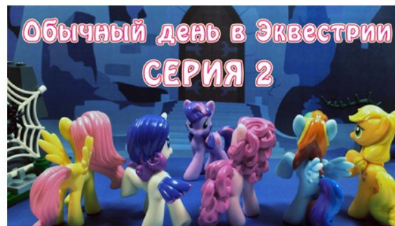
My Little Pony - Обычный день в Эквестрии - серия 2