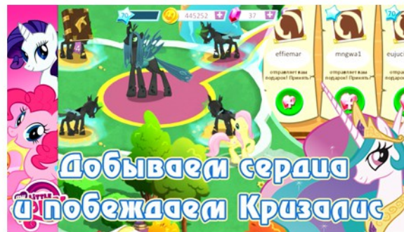
Добываем сердца и побеждаем Кризалис в игре My Little Pony